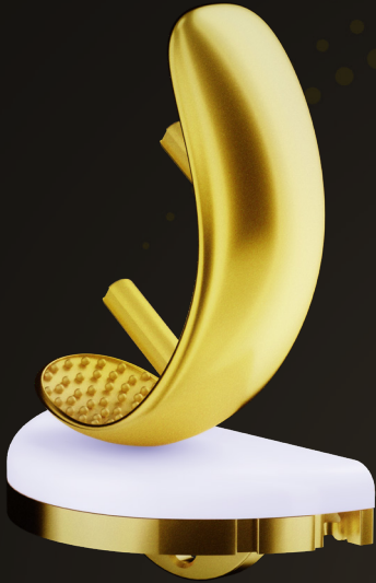
Prótesis Unicondilar LINK